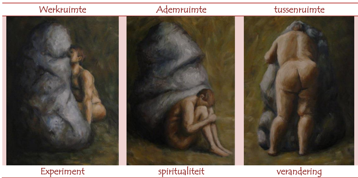
Figuur 1: Marijke Vonk

De baseline labo-levensbeschouwing-ruimte- perspectief vertelt alvast iets over de spirituele, experimentele en maatschappelijke ambities van het nieuwe Yot . Ieder huis heeft evenwel een landschap waarin het zich bevindt, een aantal vensters dat het wil opengooien, een architectuur die tussen de muren kleeft en een bouwplan dat droom in daad omzet. Zo ook heeft ook het nieuwe Yot een context , een missie , een visie en een strategie . Het is dat vierspan dat in de volgende paragrafen verder is uitgewerkt. Dit werkstuk vormt ons credo en bijgevolg hartslag en cadans van ons verhaal .