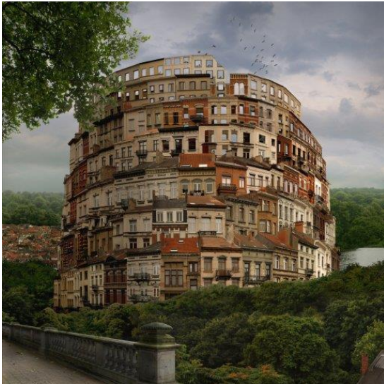
Figuur 4: E. de Ville 'De stad is een weelderig mozaïek van gedachten die co-existeren of elkaar bevechten'.