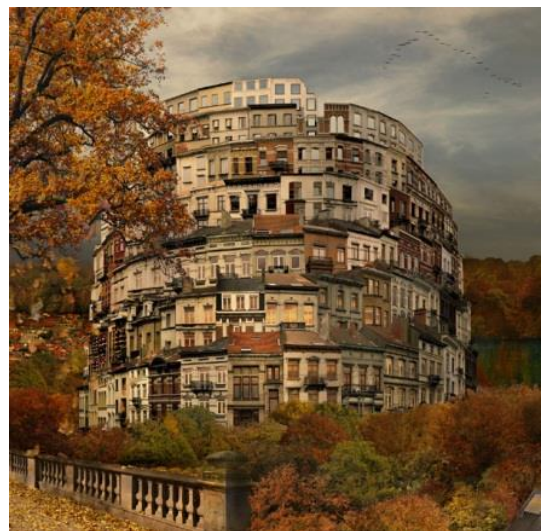
Figuur 5: E. de Ville "Elke mens wordt pas mens in ontmoeting"

Samen met een aantal theologen uit de joods-christelijke traditie geloven wij daarom in het enorme spirituele potentieel dat in elke mens verscholen ligt, maar vaak wordt ondergesneeuwd door het moderne functionele denken. Het is die innerlijke schatkamer die wij, via gerichte impulsen en een intense kruisbestuiving, willen ontsluiten. Ondanks zijn spiritualiteit en kundigheid zijn we ervan overtuigd dat elke mens pas echt mens wordt in de ontmoeting met andere mensen. Daarom investeren we in een platform voor betrokkenheid, dialoog en interactie. Dit positief mens- en wereldbeeld weerhoudt ons evenwel niet van een blindheid voor de vele vormen van geweld in onze samenleving, maar helpt ons juist om, wars van clichés, met de stad samen te zoeken naar antwoorden op de uitdagingen die zich