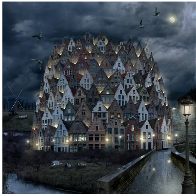
Figuur 6: E. de Ville 'Op die manier wordt samenleven niet herleid tot het creëren van een onpersoonlijke, functionele neutrale zone'

Het is precies deze vorm van christelijke waarheid als zoekontwerp dat resulteert in een eigen vorm van christelijk pluralisme. We bieden daarmee een tegengewicht aan andere vormen van pluralisme die vertrekken vanuit het neutraliteitsbeginsel. Omdat elk waarheidsconcept telkens opnieuw ontoereikend is, ontkennen we het bestaan en het nut van enige neutrale ruimte en kiezen we resoluut voor de niet aflatende dialoog. Wij herkennen dit nooit aflatende, dynamische proces in het joods-christelijke verhaal en durven deze vorm van actief pluralisme inherent aan het christendom te noemen. In die zin kiezen wij voor een christologie die het pluralisme niet enkel als uitdaging ziet omdat de dialoog met andere tradities funderend is voor haar eigen identiteit, maar ook omdat zij een christelijke kerntaak is.